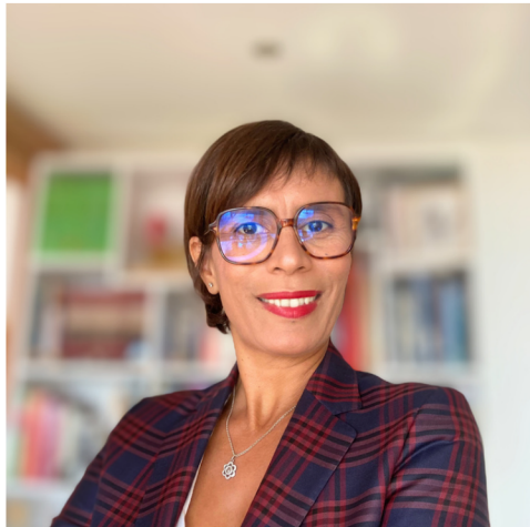
album photo disponible sur demande